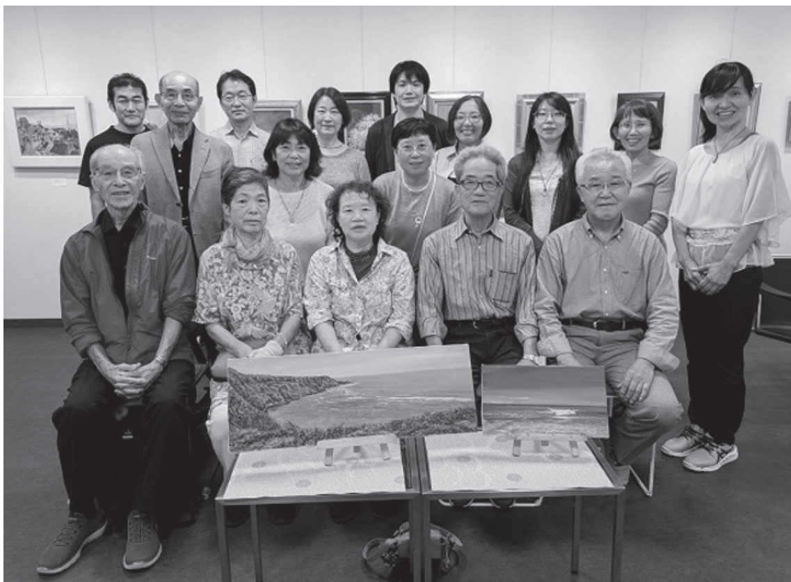
「2024 年アズビルアート展」での集合写真