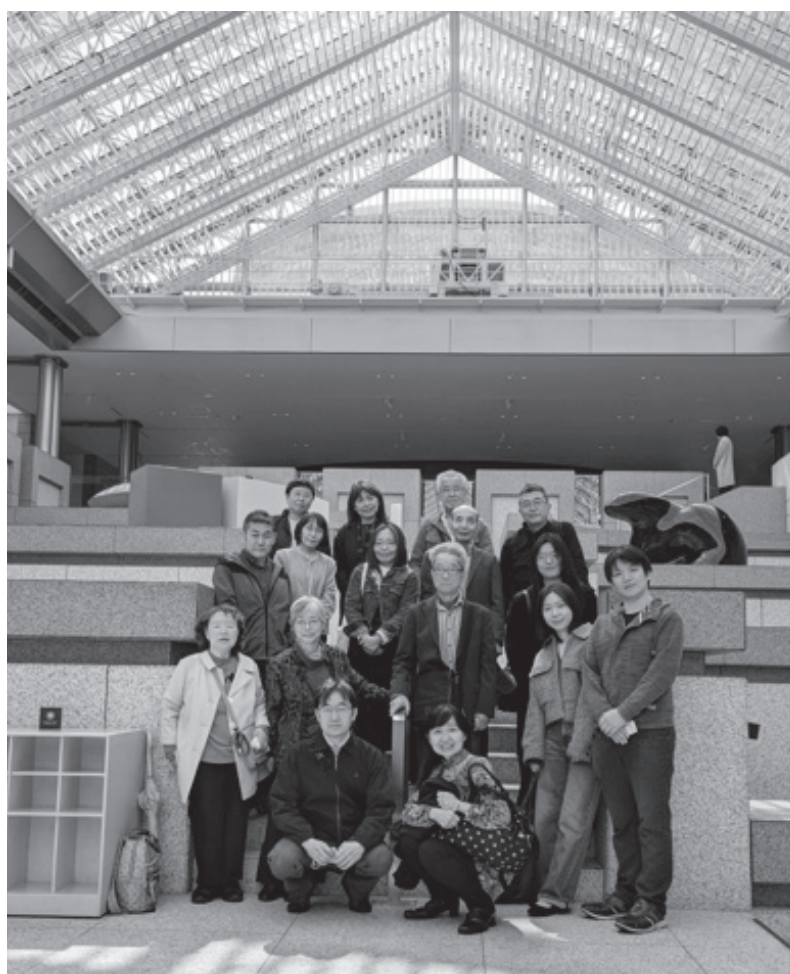
アズビル美術部での鑑賞会 リニューアルされた「横浜美術館」にて