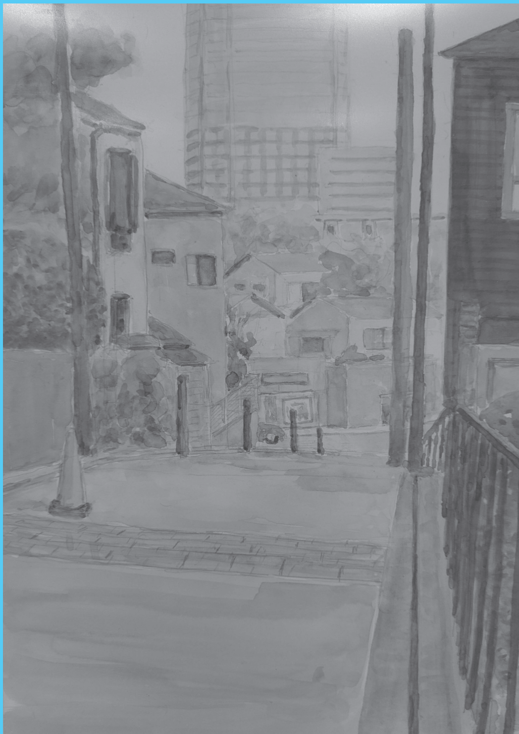
作品名：「山手の坂道」