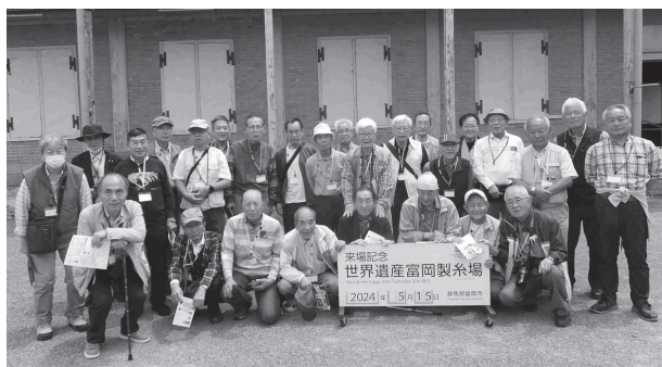
▲バス1号車 集合写真 @富岡製糸場