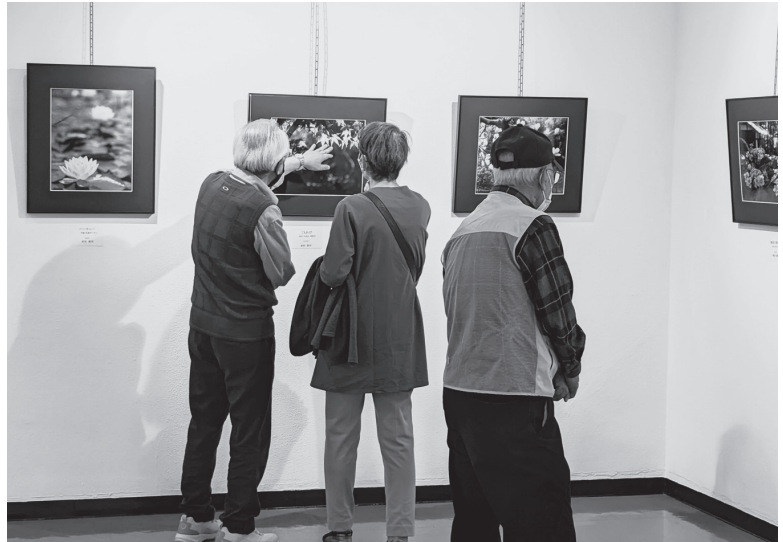
第23回 写楽会場（最後の開催でした！）

1999年に発足して25年、諸先輩が「写楽」を盛り上げて来ましたが、残念ながら現在の会員4名では例会などの運営が困難になってきており、今回の第23回展をもって解散する事を決めました。4名の写真展でしたが、展示数を各人が増やして会員の個性を発揮した素晴らしい作品展示となりました。