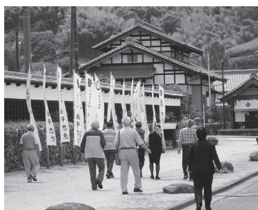
(歴史地区)

次に甘楽歴史地区を訪問散策しました。織田宗家ゆかりの大名庭園「楽山園」は国指定名勝で池の周りに築山や茶屋が配されており心休まるひと時を過ごせました。