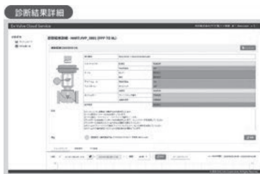
▲ Dx Valve Cloud Service 診断結果詳細画面

バルブの状態をよりタイムリーに正確に把握し、その維持管理を時間基準保全（TBM: Time Based Maintenance）から状態基準保全（CBM: Condition Based Maintenance）へ移行することで、バルブの点検時間を削減するとともに故障検知の迅速化を実現します。また定期的なレポートを活用することで、メンテナンス計画に要する時間を削減、メンテナンスの効率化とプラントの生産性向上を図り、プラントの安全・安定稼働、保安力の向上に寄与します。