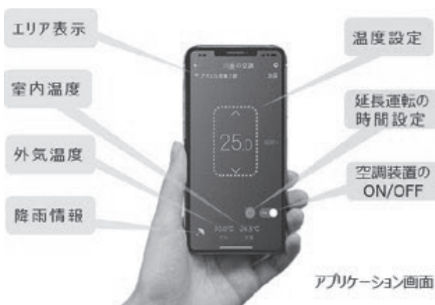
▲操作システムのアプリケーション画面

今後は、スマートフォンの位置情報を活用して、近くの空き会議室のお知らせ・予約といった機能も追加する予定です。機能の充実により、オフィスビル・テナントビルの執務者が集中できるオフィス環境・利便性向上にさらに貢献し、生産性向上をサポートする取組みを継続してまいります。