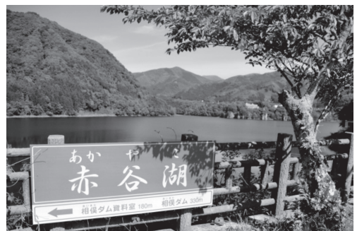
(赤谷湖 - 撮影者：黒瀬吉郎さん)

朝食後ホテル周辺の散策で美しい湖を発見しました。赤谷湖と言うそうで、周囲を桜並木の遊歩道に囲まれており、遠くには残雪の山々が見えました。