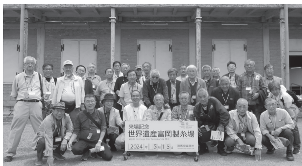
▲バス2号車 集合写真 @富岡製糸場

次に甘楽歴史地区を訪問散策しました。織田宗家ゆかりの大名庭園「楽山園」は国指定名勝で池の周りに築山や茶屋が配されており心休まるひと時を過ごせました。